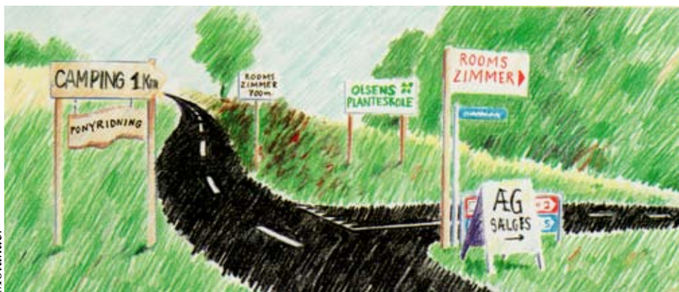
Ikke kaos eller store reklamer i det åbne land