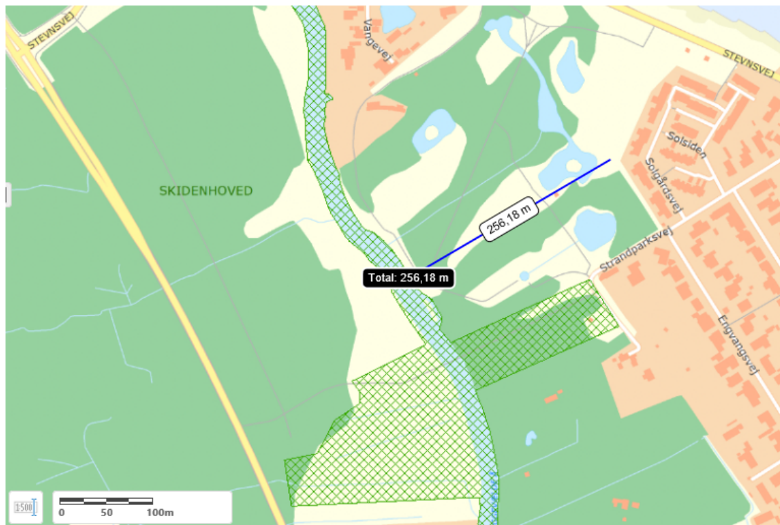
Fig. 2. Grøn skravering er udpeget som Natura 2000-område.

Planområdet ligger i en afstand af ca. 250 meter fra Tryggevælde Å, som er en del af Natura 2000-område nr. 149. Den sydvestlige del af planområdet ligger umiddelbart op til samme Natura 2000-område ved Strandparksvej. Se figur 2.