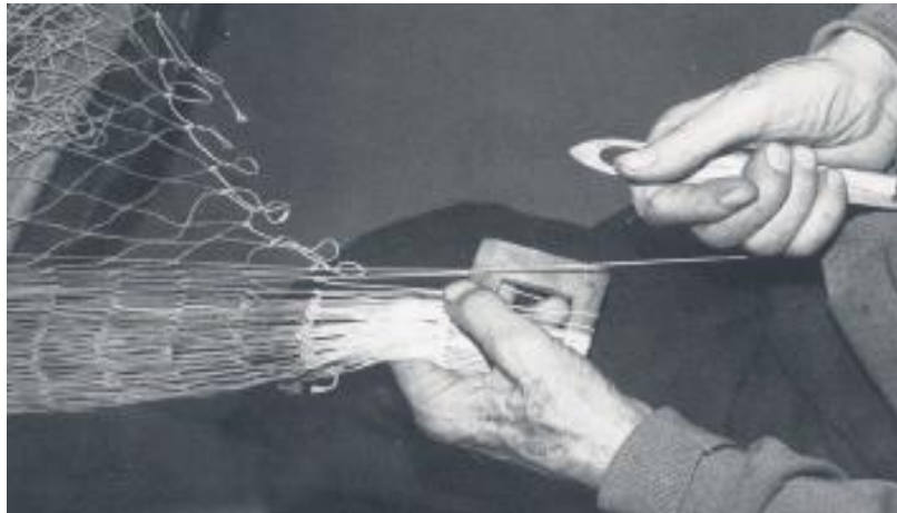
SSP-Samarbejde er netværksarbejde – det skabes, når nettet samles