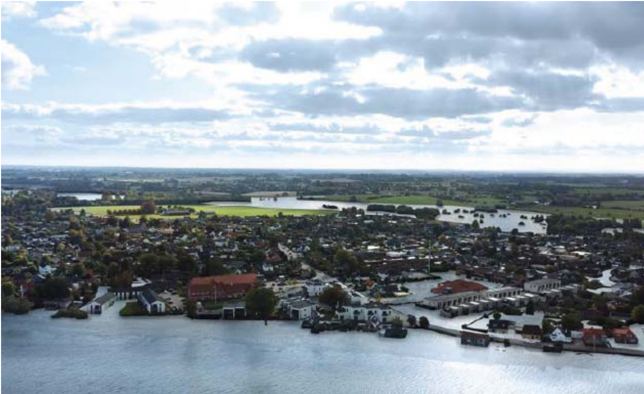
Eksempel på en af visualiseringerne i scenariedokumentet (vandstand til kote 2,80 m)

Du kan læse hele scenariedokumentet her ( direkte link ) eller finde det øverst på Stevns Kommunes hjemmeside om projektet her: